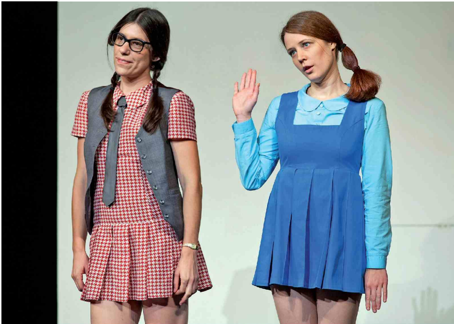
Treasure in India kljub socialnim razlikam takoj postaneta najboljši prijateljici.