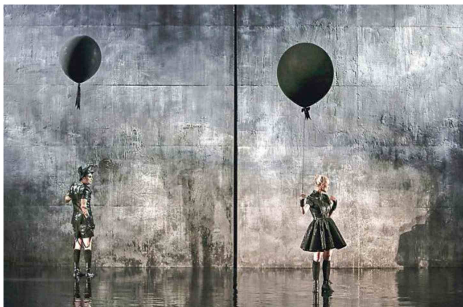
Pandurjevega Fausta čakajo še najmanj tri leta globalnega življenja.