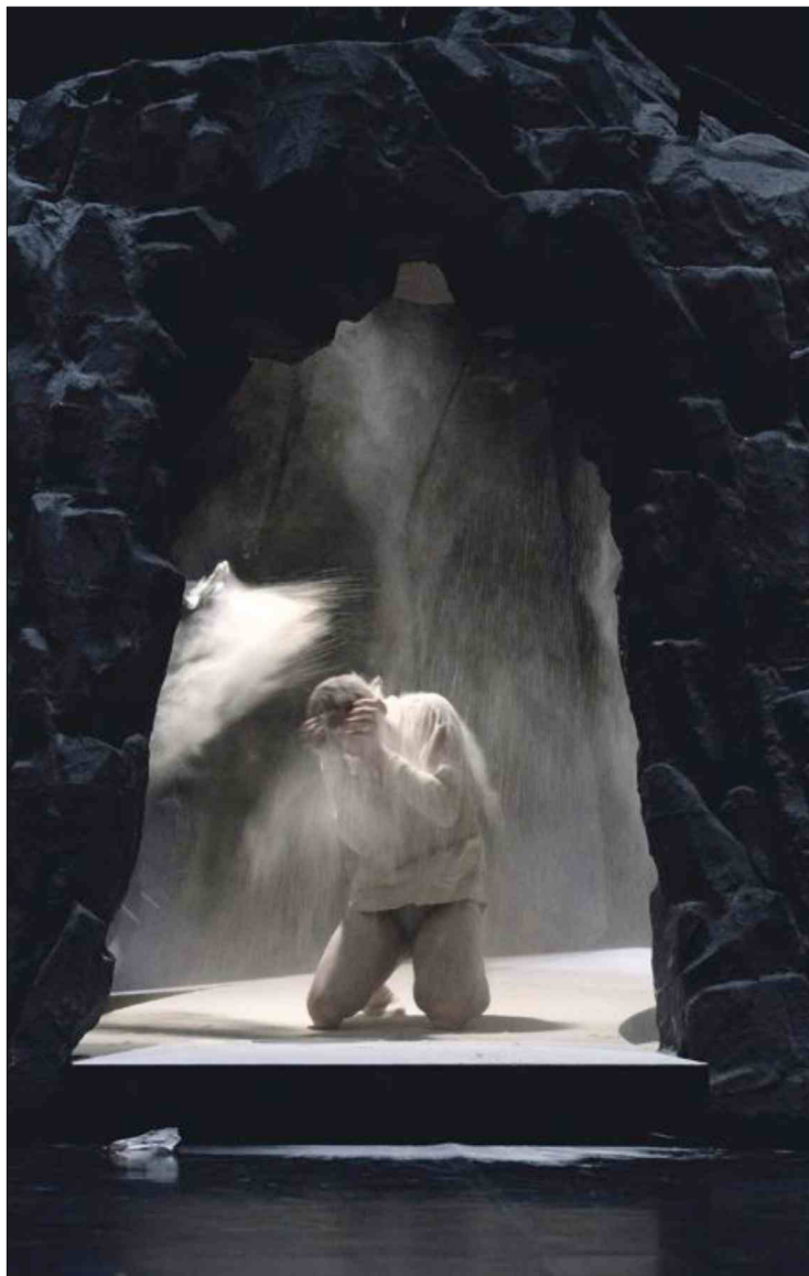
Balet Peer Gynt je odprl Festival Borštnikovo srečanje.