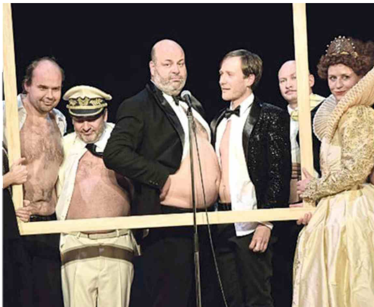
Kralj Ubu v ljubljanski Drami