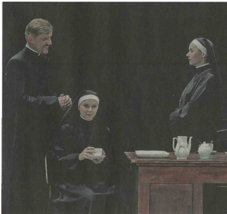
John Patrick Shanley: Dvom