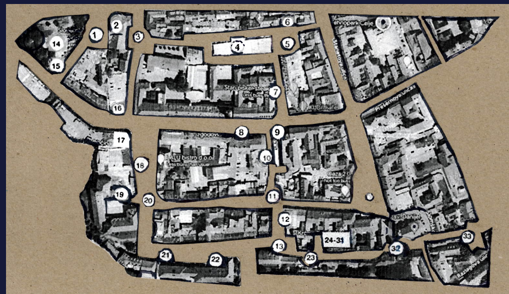
Potovanje po Troji